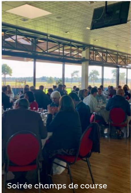
Soirée champs de course