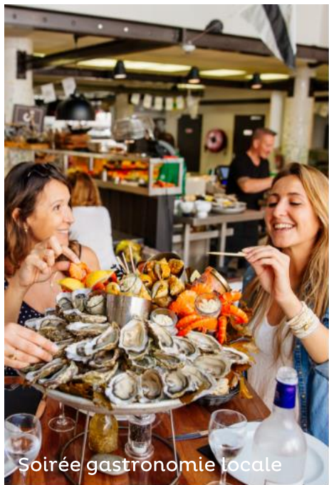
Soirée gastronomie locale