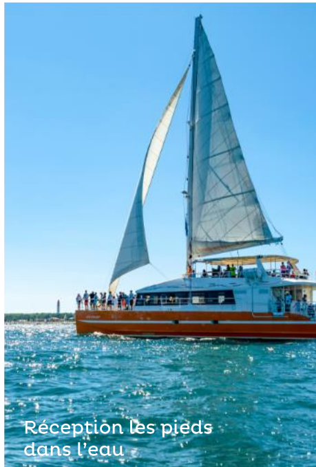
Réception les pieds dans l'eau