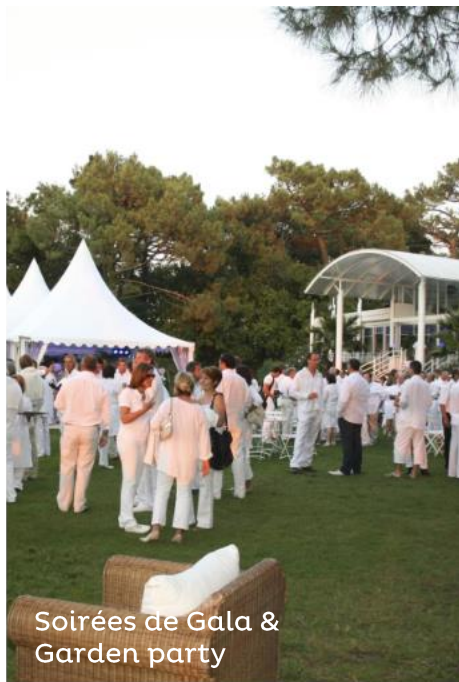
Soirées de Gala & Garden party