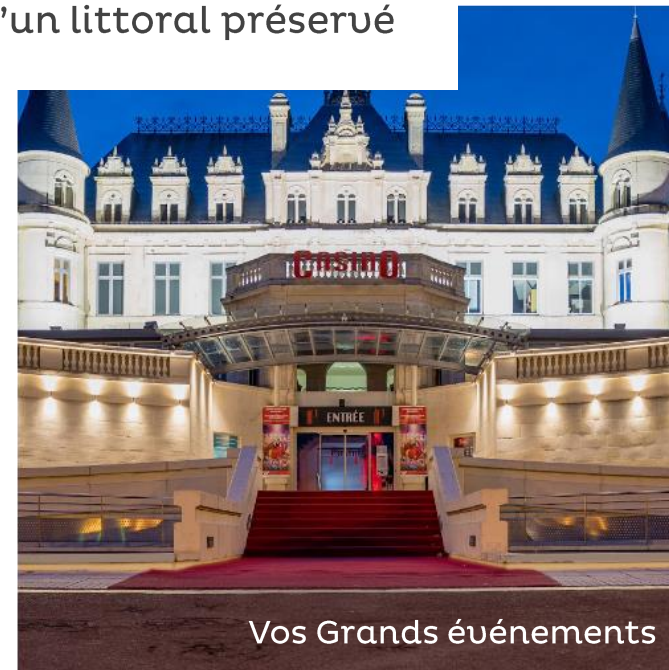
La Teste de Buch

SUD BASSIN Le dynamisme d'un littoral préservé