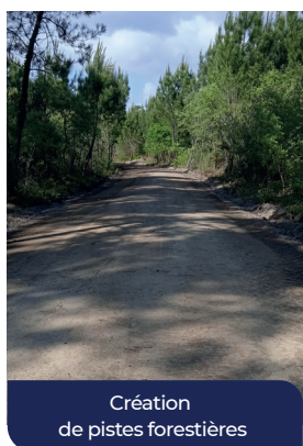
Création de pistes forestières