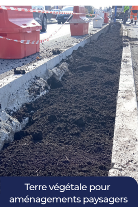
Terre végétale pour aménagements paysagers